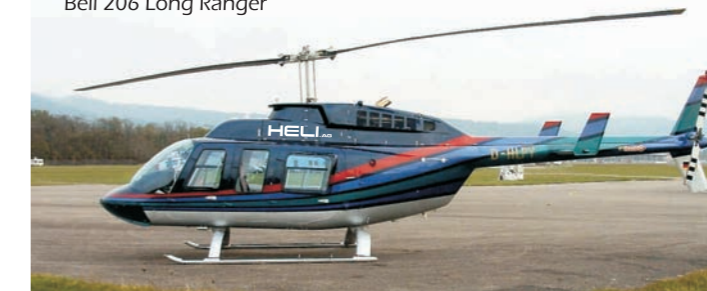
Bell 206 Long Ranger

Lassen Sie sich einfach überraschen oder überraschen Sie selbst jemanden mit einem GUTSCHEIN