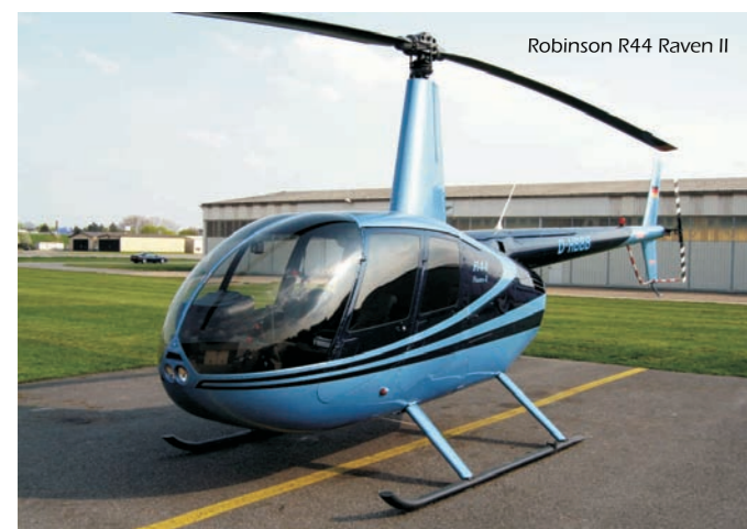
Robinson R44 Raven II

Hier erfahren Sie alle für Sie bedeutsamen rechtlichen Vorschriften der Luftfahrt.