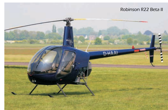
Robinson R22 Beta II

http://www.kba.de/cln007/nn125874/DE/ZentraleRegister/VZR/Auskunft/vzr_auskunft_inhalt.html