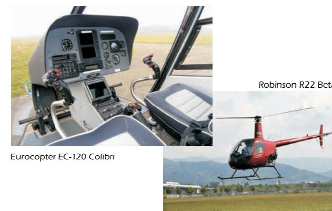
Robinson R22 Beta II

Wenn diese Voraussetzungen erfüllt sind, schließen Sie mit uns Ihren Ausbildungsvertrag ab und mit der Ausbildung kann begonnen werden.