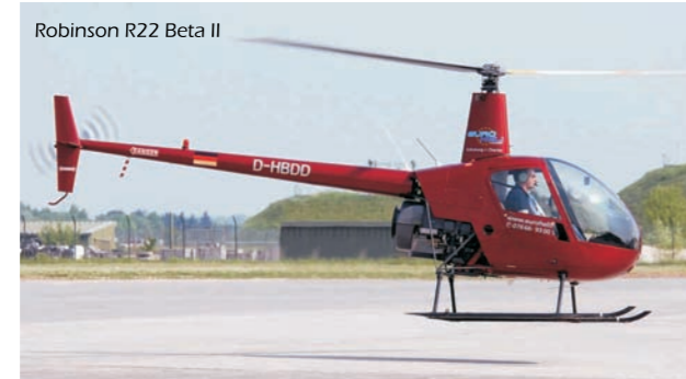
Robinson R22 Beta II

Wieder sind das Erlebnisse von dauerhafter Prägung. Sie fliegen allein eine Flugstrecke und werden auf einem entfernten Flugplatz landen und wieder starten.